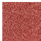
B1887001 Rose ancien