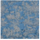
B7544006 Bleu faïence