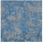
B7544006 Bleu faïence