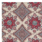
B7550003 Bleu ancien