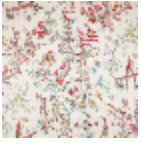
B7553001 Gris bleu