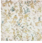
B7553002 Vert persan