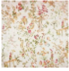
B7553003 Brun de toledo