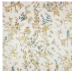
B7553002 Vert persan