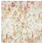
B7553003 Brun de toledo