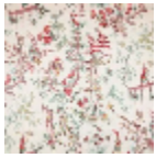
B7553001 Gris bleu