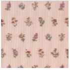
B7564001 Vieux rose