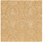
B7569001 Jaune d'or