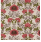
B7572001 Rose lilas