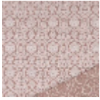
B7606004 Vieux rose