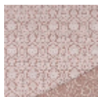
B7606004 Vieux rose