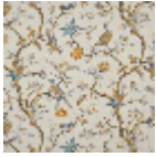
B7634002 Bleu ocre