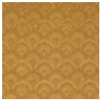
B7668003 Vieil or