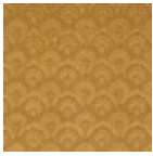
B7668003 Vieil or