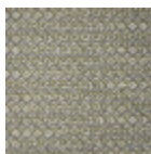
B7672004 Grandes eaux