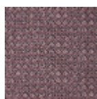
B7672002 Bleu garance