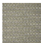
B7672004 Grandes eaux