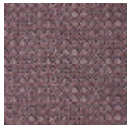
B7672002 Bleu garance