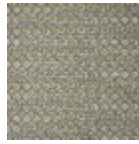
B7672004 Grandes eaux