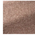
B7673008 Fraise des bois