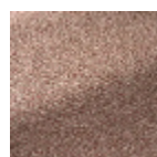
B7673008 Fraise des bois