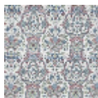
B7690003 Bleu garance