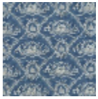
F2056001 Bleu ancien