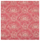
F2056002 Rose ancien