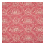
F2056002 Rose ancien