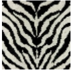
F2222002 Fond blanc