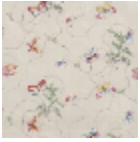
F2635001 Rose mauve