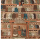
F2721001 Laque de chine