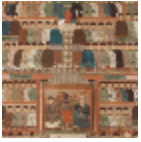
F2721001 Laque de chine