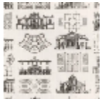
F2747001 Mine de plomb