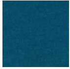
F2754015 Bleu nattier