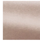
F2945014 Rose ancien