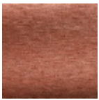
F2982026 Vieux rose