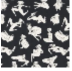
F2984001 Noir & blanc