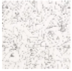
F2986001 Noir & blanc