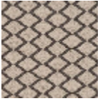
F3015001 Ombre naturelle