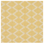
F3015002 Terre jaune