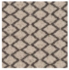
F3015001 Ombre naturelle