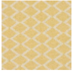
F3015002 Terre jaune