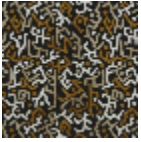
F3110001 Noir & or