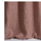
F3128026 Rose ancien