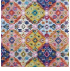
F3142001 Tutti frutti