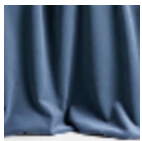
F3210019 Deep sky