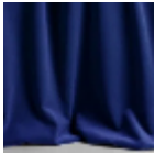
F3210020 Lapis lazuli