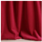
F3210032 In love