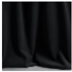
F3210006 Simple black