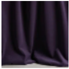
F3210021 God save the queen