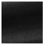
F3211006 Simple black