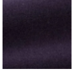
F3212013 God save the queen