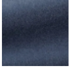
F3212012 Deep sky