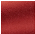
F3212020 In love