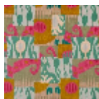
F3226002 Acid lime