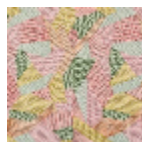
F3228002 Tutti frutti