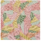
F3228002 Tutti frutti