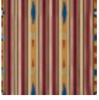
F3238001 Sable rose