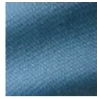
F3264006 Bord de mer