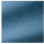
F3264006 Bord de mer