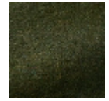
F3290009 Sous bois