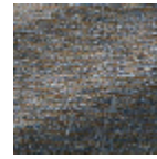
F3291008 Bord de mer