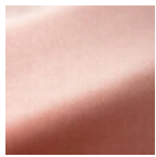
F3370024 Flamant rose