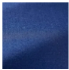
F3372023 Yves klein