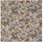
F3385002 Un jardin anglais