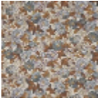
F3385002 Un jardin anglais