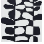
F3485001 Noiret blanc