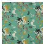
F3536002 Menthe a l'eau