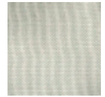
F3543009 Vert d'eau